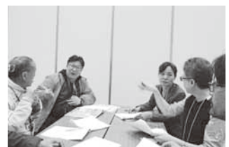
法務局人権擁護部と綿密な打合せ