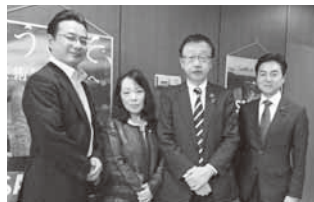
右から2人目 札幌市副市長 町田隆敏様