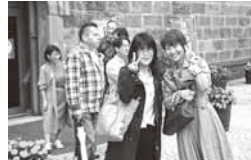
ランチに舌つつみ