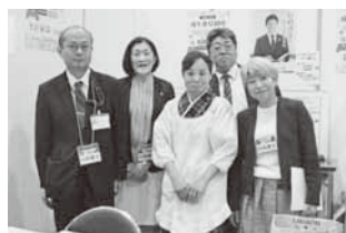
相談員とステージ出演者集合